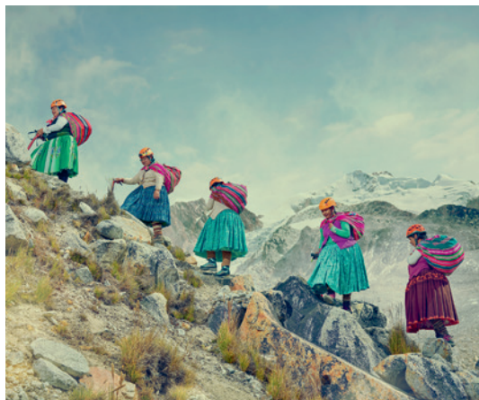
© TODD ANTONY · THE BEST OF LENS CULTURE VOL. 4