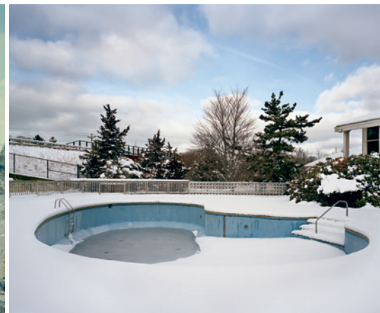
© BRIAN KAPLAN · I'M NOT ON YOUR VACATION