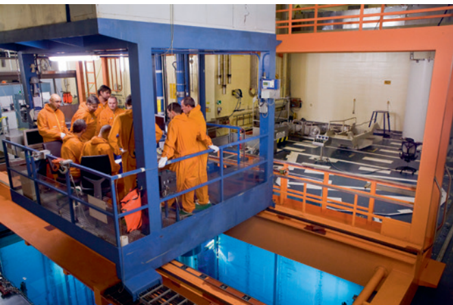
EEN STRALEND VERLEDEN