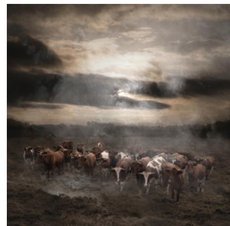
LANDSCAPE #51