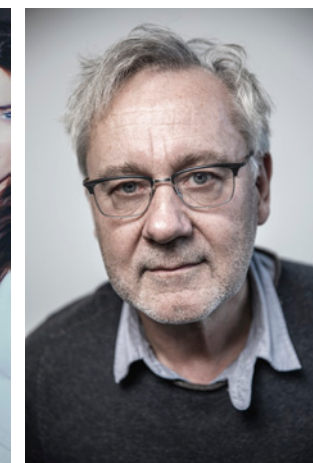
MICHAEL WOLF © ROB BECKER